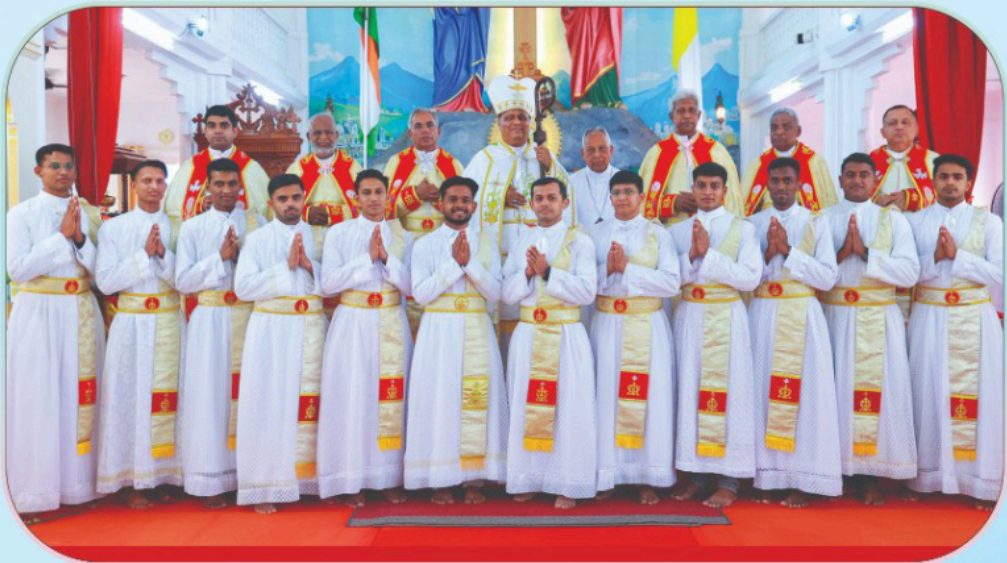
തലശ്ശേരി അതിരൂപതയ്ക്കുവേണ്ടി ഡീക്കൻ പട്ടം സ്വീകരിച്ച വൈദികവിദ്യാർത്ഥികൾ അഭിവന്ദ്യ പിതാവിനോടൊപ്പം മാർച്ച് 21, 2026