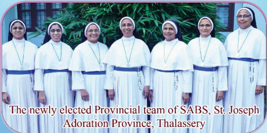
The newly elected Provincial team of SABS, St. Joseph Adoration Province, Thalassery