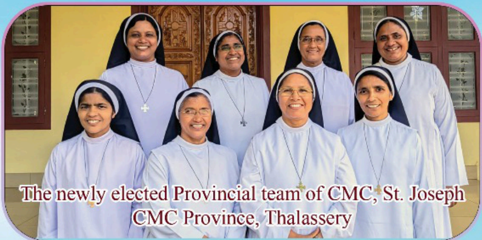
The newly elected Provincial team of CMC, St. Joseph CMC Province, Thalassery

അഭിനന്ദനങ്ങൾ അഭിനന്ദനങ്ങൾ അഭിനന്ദനങ്ങൾ അഭിനന്ദനങ്ങൾ അഭിനന്ദനങ്ങൾ അഭിനന്ദനങ്ങൾ അഭിനന്ദനങ്ങൾ