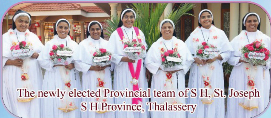
The newly elected Provincial team of S H, St. Joseph S H Province, Thalassery