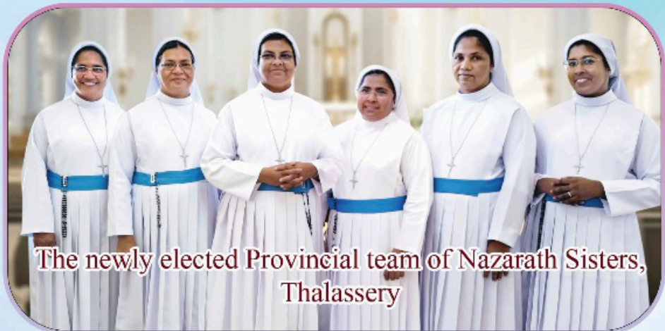
The newly elected Provincial team of Nazarath Sisters, Thalassery

അഭിനന്ദനങ്ങൾ അഭിനന്ദനങ്ങൾ അഭിനന്ദനങ്ങൾ അഭിനന്ദനങ്ങൾ അഭിനന്ദനങ്ങൾ അഭിനന്ദനങ്ങൾ അഭിനന്ദനങ്ങൾ