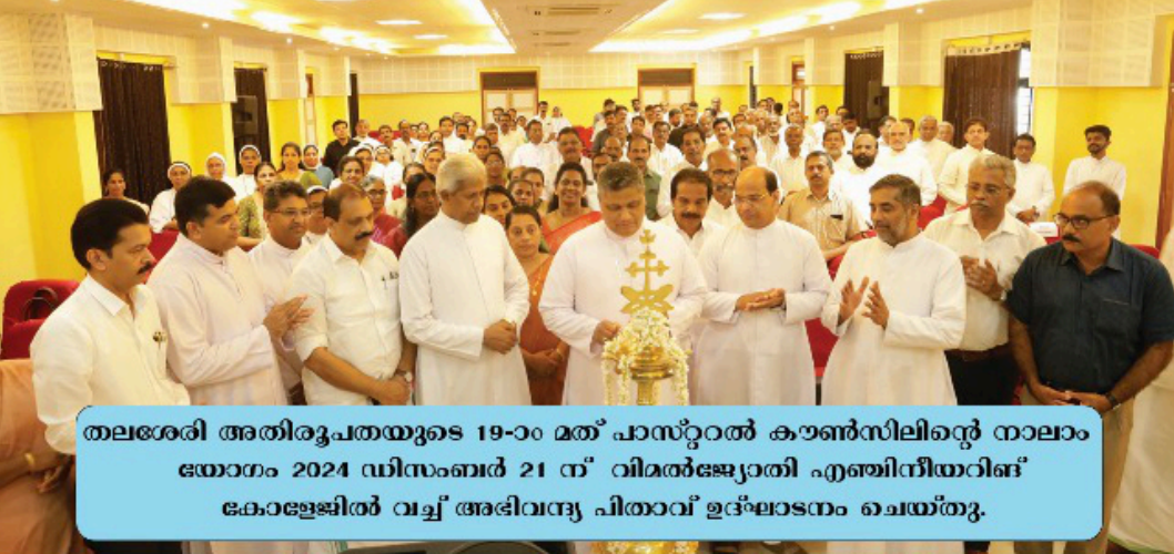
തലശ്ശേരി അതിരൂപതയുടെ 19-ാം മത് പാസ്റ്ററൽ കൗൺസിലിന്റെ നാലാം യോഗം 2024 ഡിസംബർ 21 ന് വിമൽജ്യോതി എഞ്ചിനീയറിങ് കോളേജിൽ വച്ച് അഭിവന്ദ്യ പിതാവ് ഉദ്ഘാടനം ചെയ്തു.