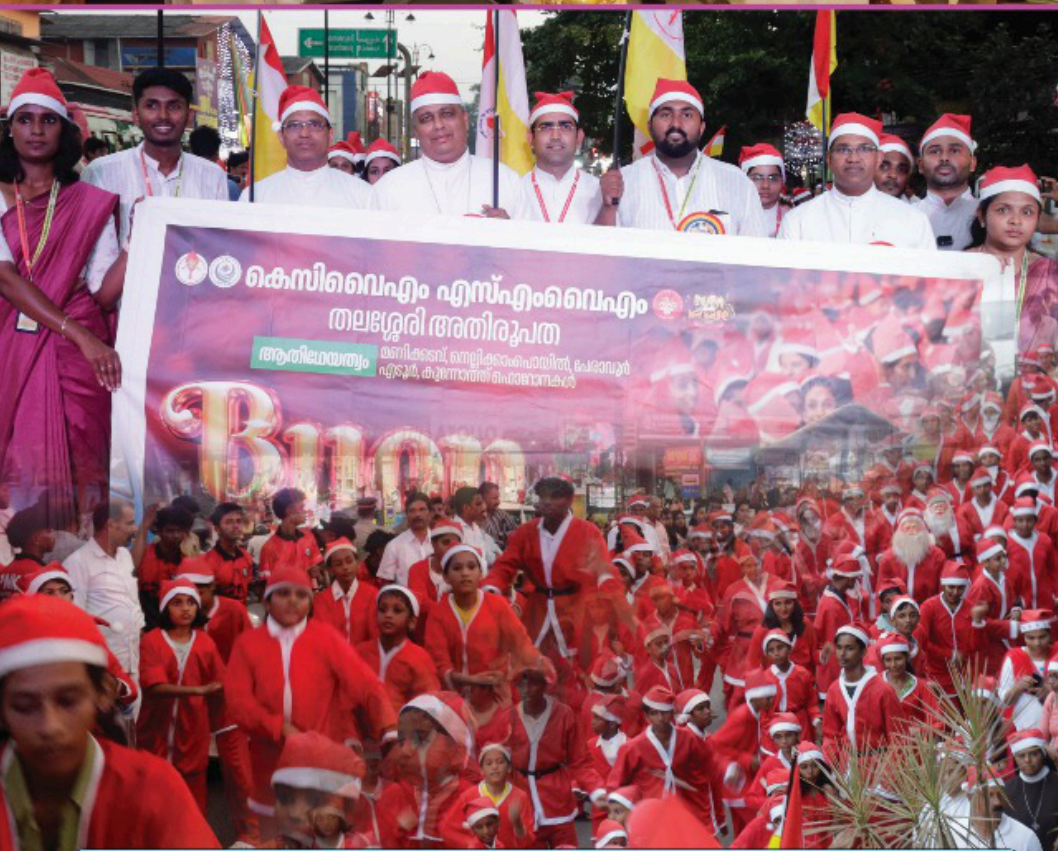
തലശ്ശേരി അതിരൂപതാ KCYM / SMYM ന്റെ നേതൃത്വത്തിൽ 2024 ഡിസംബർ 21 ന് ഇരിട്ടിയിൽ നടന്ന ക്രിസ്തുമസ് ആഘോഷം, ബോൺ നത്താലെ.