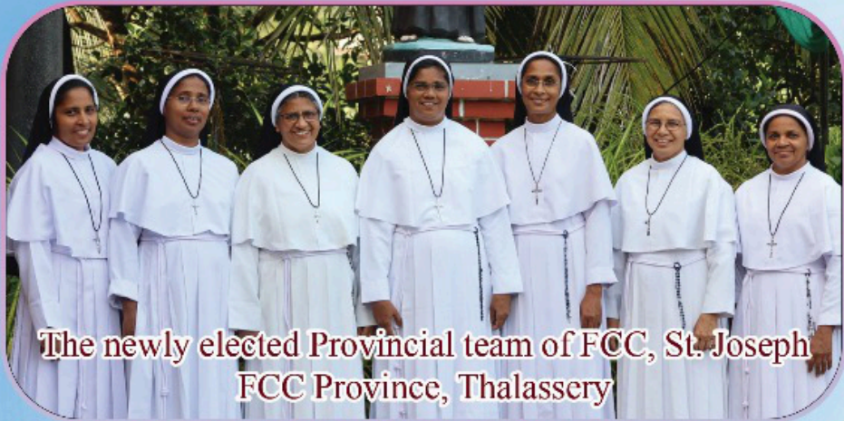
The newly elected Provincial team of FCC, St. Joseph FCC Province, Thalassery