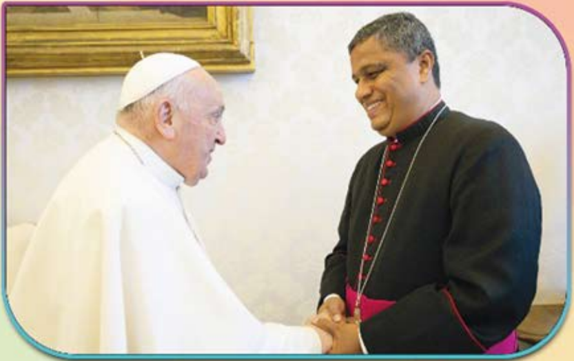
അഭിവന്ദ്യ മാർ ജോസഫ് പാംപ്ലാനി പിതാവ് റോമിൽ പരിശുദ്ധ പിതാവ് ഫ്രാൻസിസ് മാർപ്പാപ്പയെ സന്ദർശിച്ചപ്പോൾ 13 മെയ് 2024