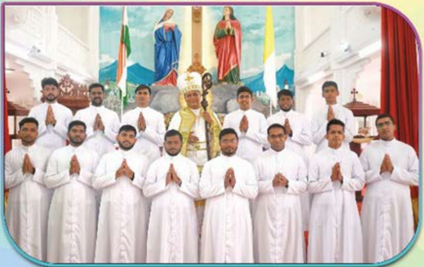
തലശേരി അതിരൂപതയ്ക്കുവേണ്ടി ഈ വർഷം വൈദികവസൂത്രം സ്വീകരിച്ച വൈദികവിദ്യാർത്ഥികൾ അഭിവന്ദ്യ പിതാവിനോടൊപ്പം 01 മെയ് 2024